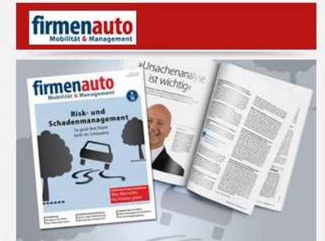
firmenauto 09/2018 Download der Print-Ausgabe