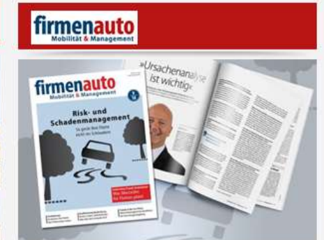
firmenauto 09/2018 Download der Print-Ausgabe