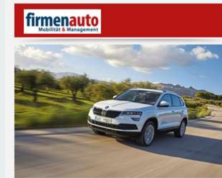
Kaufberatung Skoda Karoq Der Platzmeister

Der Skoda Karoq zählt zu den geräumigsten Kompakto-SUV. Aber wie sieht's mit den Kosten aus? Und taugt der Tacheche als Firmenwagen? Eine Kauf-Beratung.